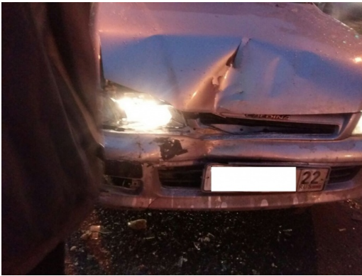
Авария произошла на улице Дуси Ковальчук

Утром 14 ноября пассажир маршрутки пострадал в ДТП на улице Дуси Ковальчук в Заельцовском районе Новосибирска.