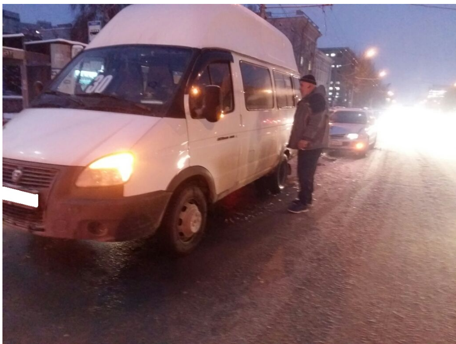
Обе машины ехали со стороны площади Калинина